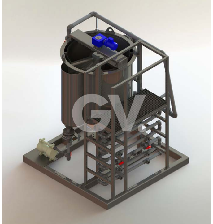
Physico-chemical treatment (DAF)