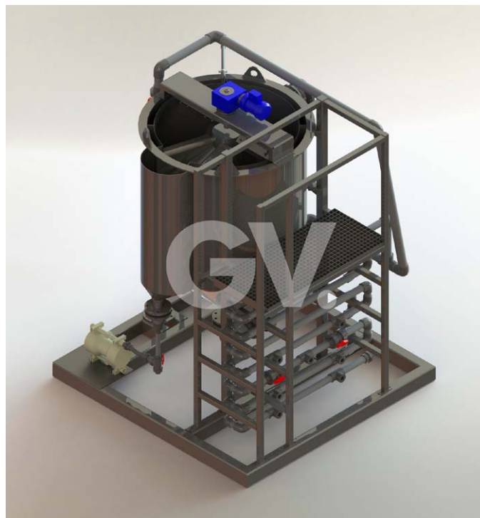
Tratamiento físico químico (DAF)