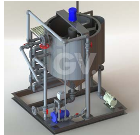
Equipo Físico químico

Los alumnos, además podrán quedar registrados en nuestra base de datos para optar a empleo en futuras instalaciones.