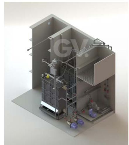
Equipo de membranas (MBR)