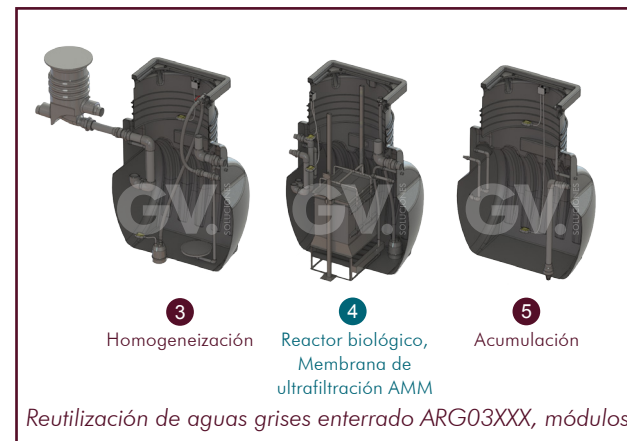
Reutilización de aguas grises enterrado ARG03XXX, módulos.