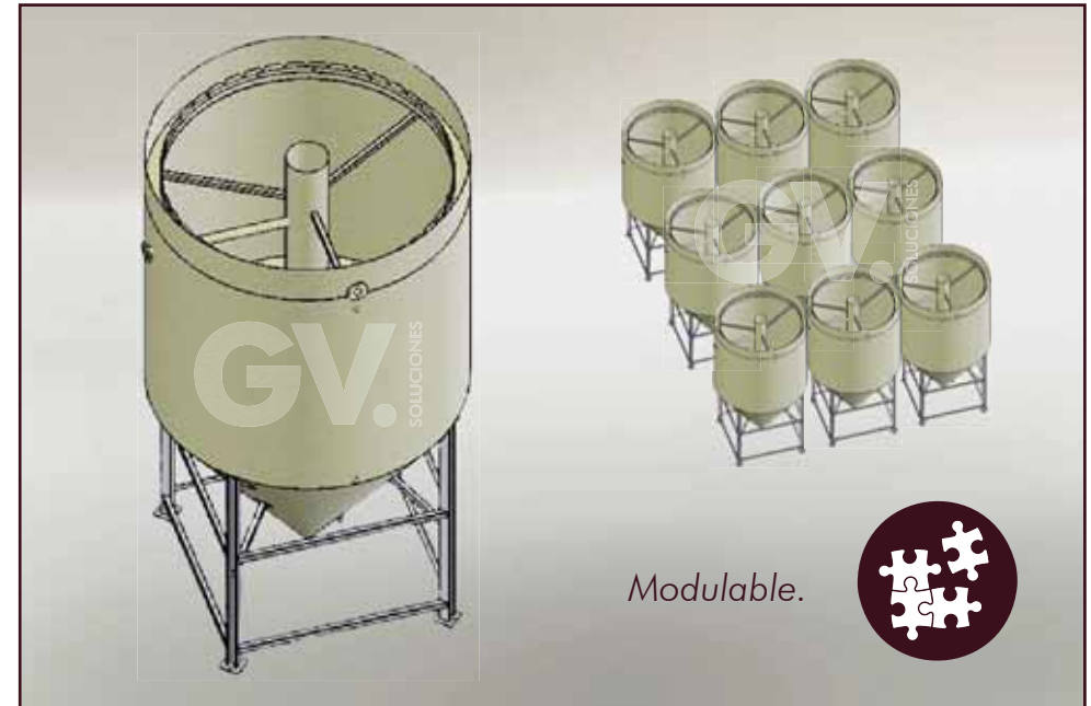
Tratamiento de fangos mediante espesadores por gravedad ASG01XXX